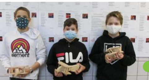
Classe de neige (2C)